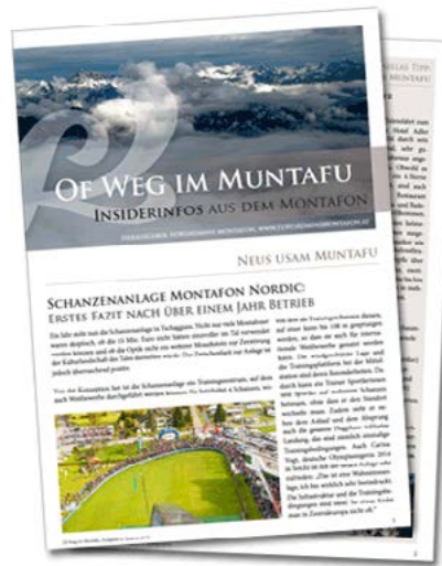
Newsletter Of Weg im Muntafu