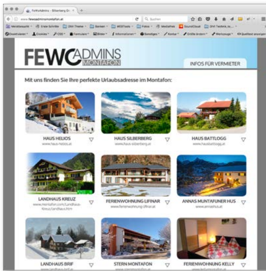
FeWoAdmins Montafon: Ferienwohnungen und Häuser