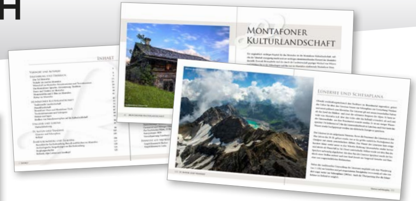
Reise- und Kulturlandschaftsführer Of Weg im Muntafu