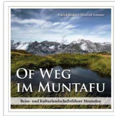
Reise- und Kulturlandschaftsführer Of Weg im Muntafu